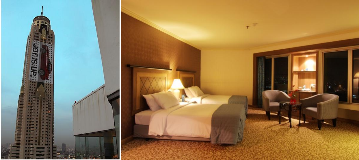
ตัวอย่างห้องพัก โรงแรมไอยกสวีท